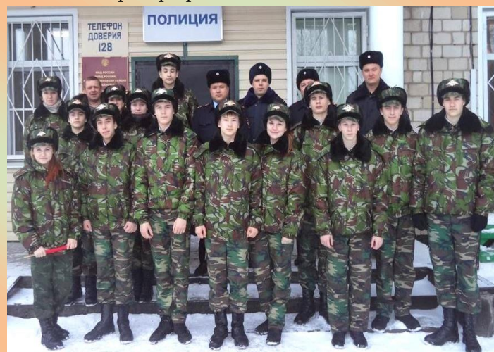
Класс правоохранительной направленности. 2014г.