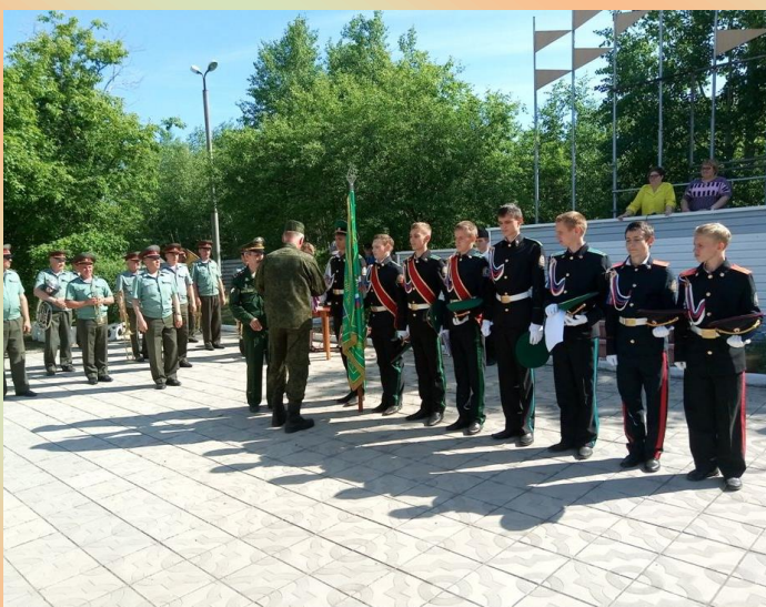
Кадеты ежегодно принимают участие в краевой военно-спортивной игре «Зарница», проходящей в рамках краевой кадетской смены на базе оздоровительного центра «Юность». 2017 год.