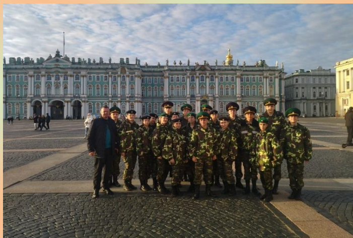
С 10 по 14 октября команда кадет Михайловского лицея приняла участие в XI Международном слете кадет России и ближнего зарубежья «Кадетское содружество». Санкт Петербург. 2023 год.