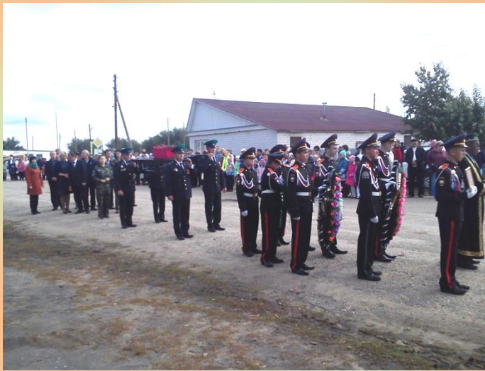
Участие в захоронении останков солдата, пропавшего без вести на фронте в годы Вов. 2017 год.