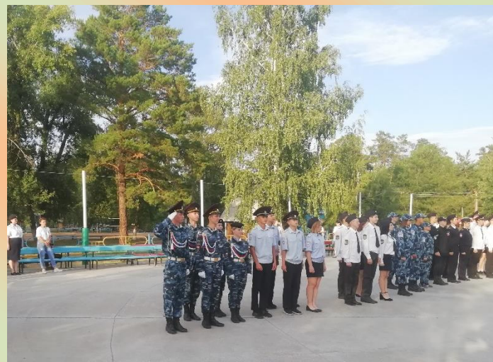
XIV Краевая профильная смена классов правоохранительной направленности «Детство – территория закона». Егорьевский район детский лагерь отдыха «Юность», 2023 год.