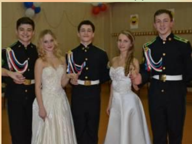
«Кадетский калейдоскоп». Победители и призеры конкурса «Кадетский бал». г. Барнаул. 2016 год.