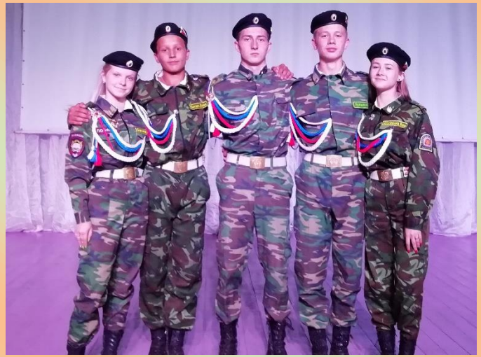
XIII Краевая профильная смена классов правоохранительной направленности «Детство – территория закона». Егорьевский район детский лагерь отдыха «Юность», 2022 год.