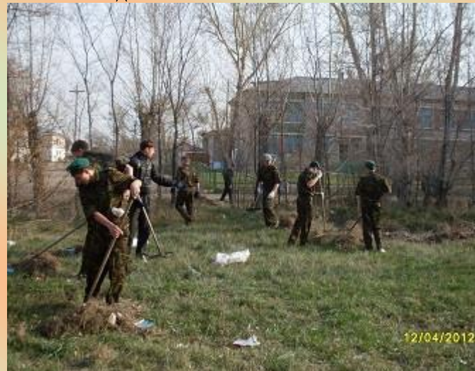
Участие в ежегодной экологической акции «Марш чистых улиц». 2012 год.