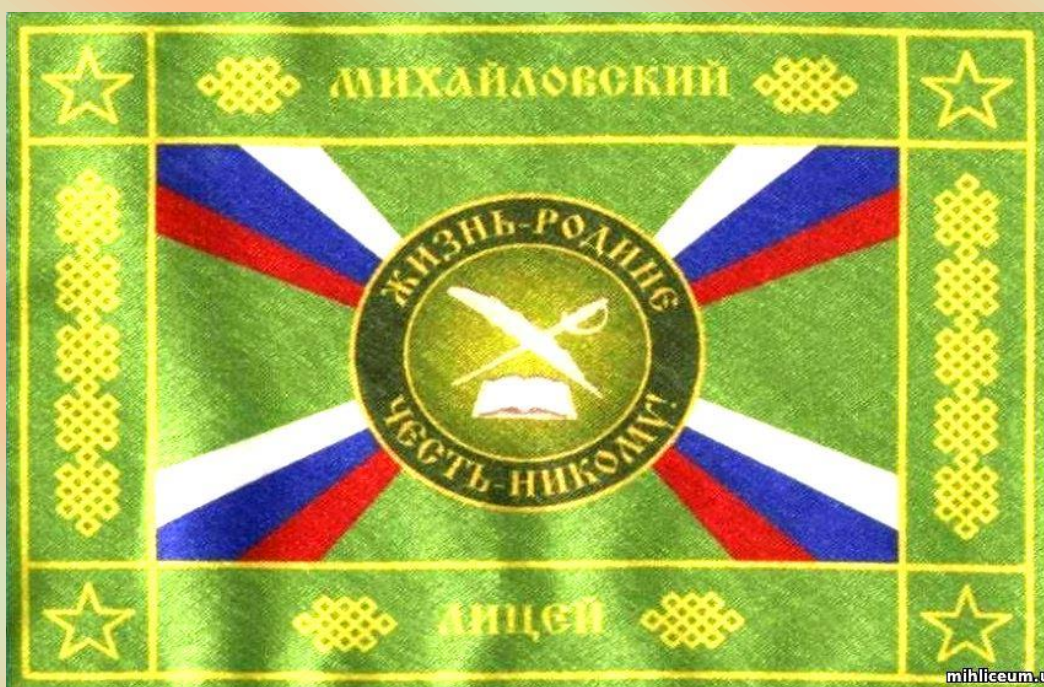
Знамя кадетских классов Михайловского лицея

кадет из семи районов Алтайского края и республики Казахстан.