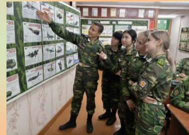
Занятие по огневой подготовке. Теория.