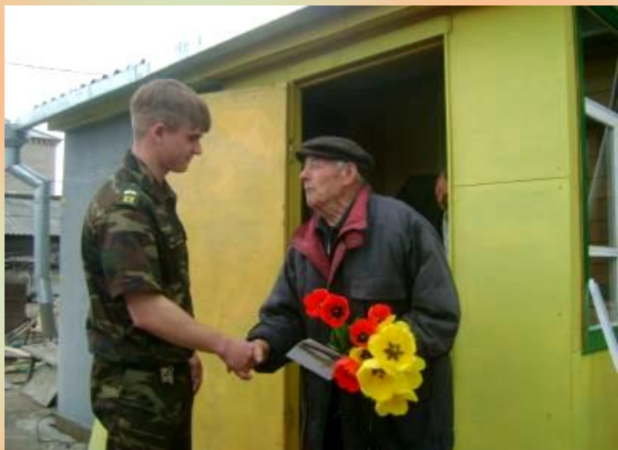
Поздравление ветеранов Великой Отечественной войны с Днем Победы - добрая традиция в лицее. 2014 год.