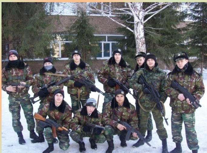
Краевой фестиваль «Кадетский калейдоскоп». г. Барнаул. 2016 год.