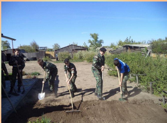
Кадеты принимают активное участие в волонтерской акции «Калейдоскоп помощи», целью которой является помощь пожилым людям. 2015 год.