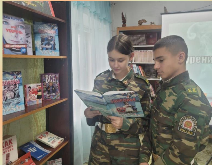
Посещение Михайловской межпоселенческой модельной библиотеки. 2023 год.