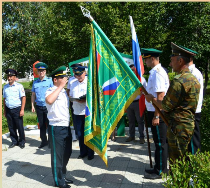
Традиционное прощание со знаменем, вручение свидетельств об окончании кадетских классов. 2019 год.