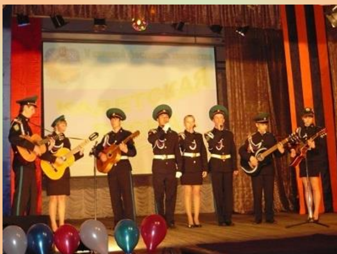
Краевой фестиваль «Кадетская весна». с. Кулунда 2012 год.