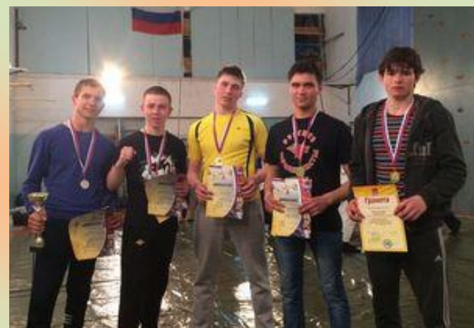
Открытое Первенство Алтайского края по кайдо. с. Поспелиха 2017 год.