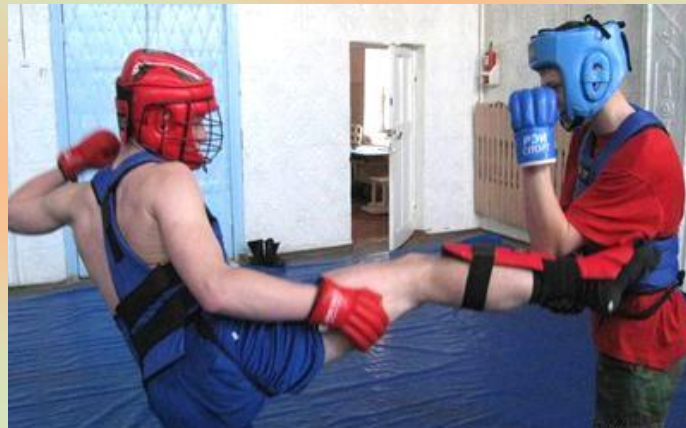
Занятие по самбо.