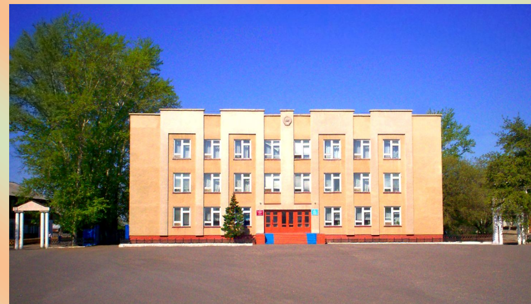
Здание Михайловского лицея

Изучение лучших традиций русского офицерства в межрайонном образовательном учреждении Михайловского кадетского корпуса сегодня продолжают порядка ста пятидесяти