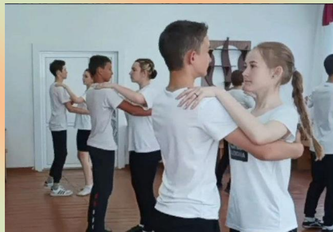
Занятие по хореографии.