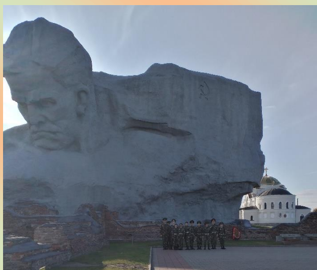
Кадеты Михайловского лицея приняли участие в гражданско-патриотической смене учащихся в Белоруссии. Брест. Мемориальный комплекс «Брестская крепость-герой». 2019 год.