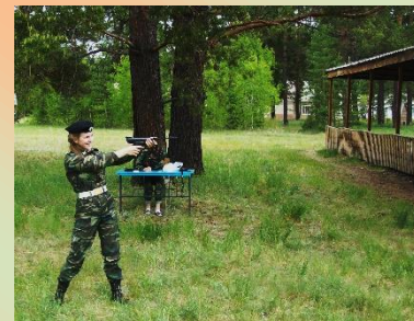
Занятие по огневой подготовке. Практика.