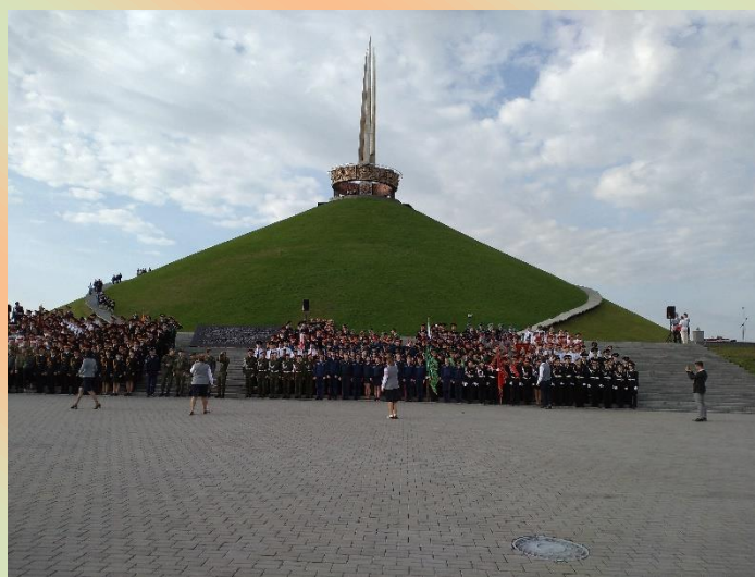
Беларусь. Минск. Поклонная гора. 2019 год.