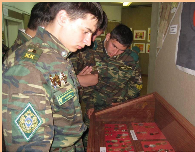
Кадеты лицея – постоянные посетители музейно-выставочного отдела Михайловского РКДЦ. 2011 год.