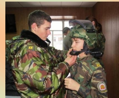
ВТД в правоохранительном классе.