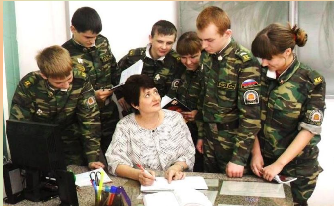
Момент работы над ошибками на уроке математики.

Для классов правоохранительной направленности своя специфика. Им предложены следующие военно-технические дисциплины: - Организационно – правовые основы деятельности полиции;