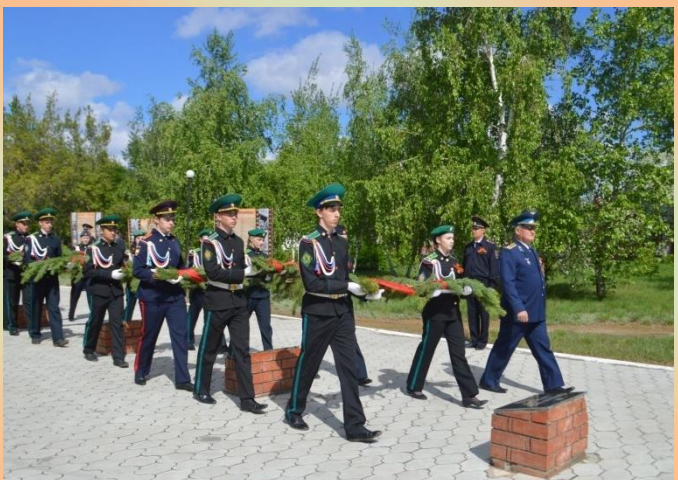
Каждый год 9 Мая кадеты принимают участие в митинге и праздничном параде, посвященном Дню Победы. 2016 год.