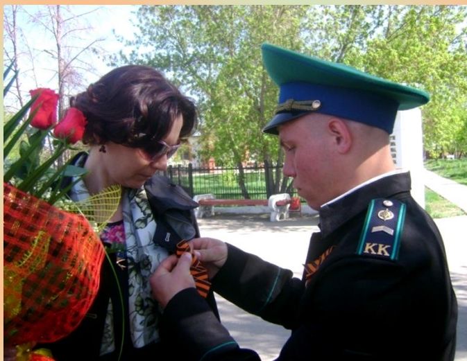
Участие в патриотической акции «Георгиевская ленточка». 2012 год.