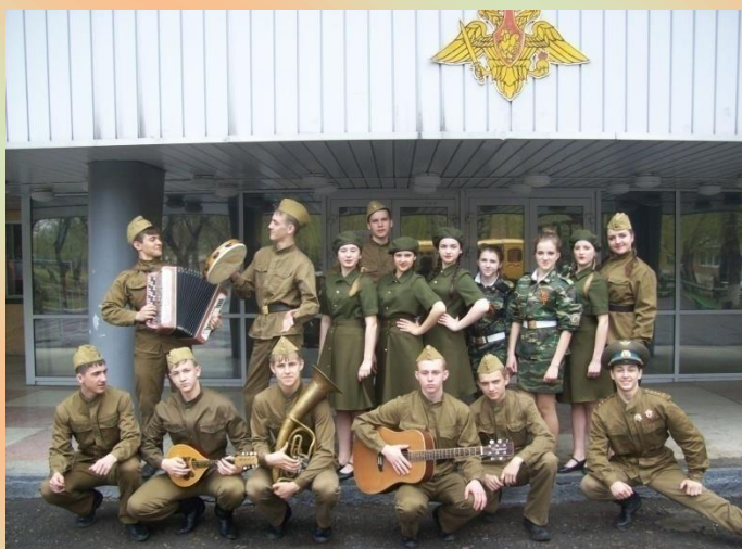
Краевой фестиваль «Кадетская весна». г. Алейск. 2016 год.