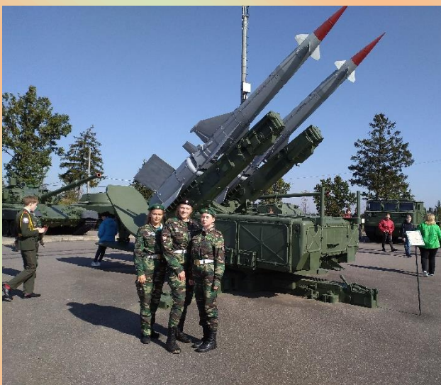
Историко-культурный комплекс «Линия Сталина». Беларусь. Минская область. 2019 год.