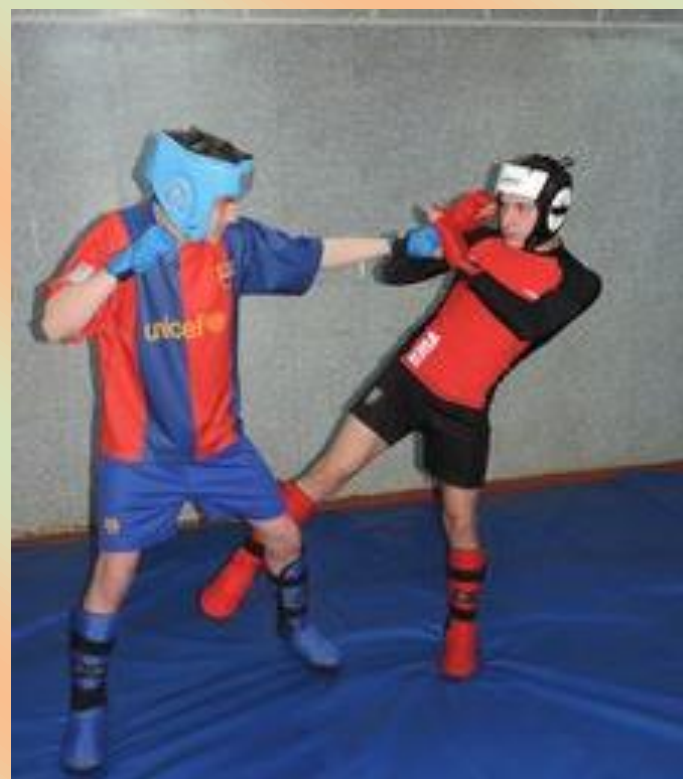
Всероссийский мастерский турнир по панкратиону памяти Героя СССР К. Павлюкова. г. Барнаул 2016 год.