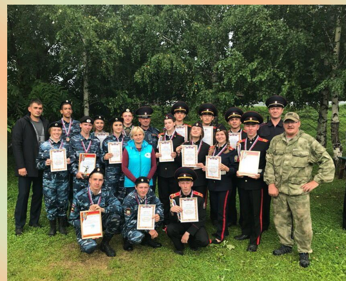
Классы правоохранительной направленности ежегодно принимают участие в краевой профильной смене классов правоохранительной направленности «Детство – территория закона», проходящей в с. Ая Алтайского района. 2018 год.