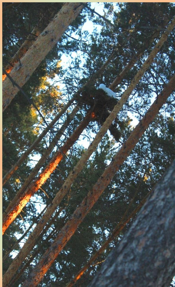
Сосны тянутся к весеннему солнышку.