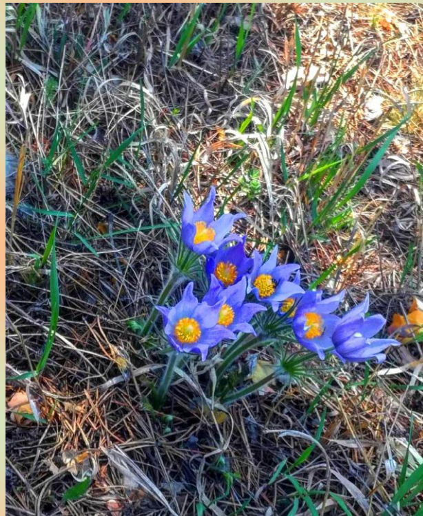
Первые весенние цветы.