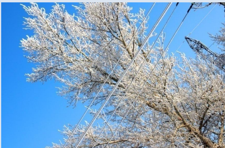
Деревья в зимнем сне.