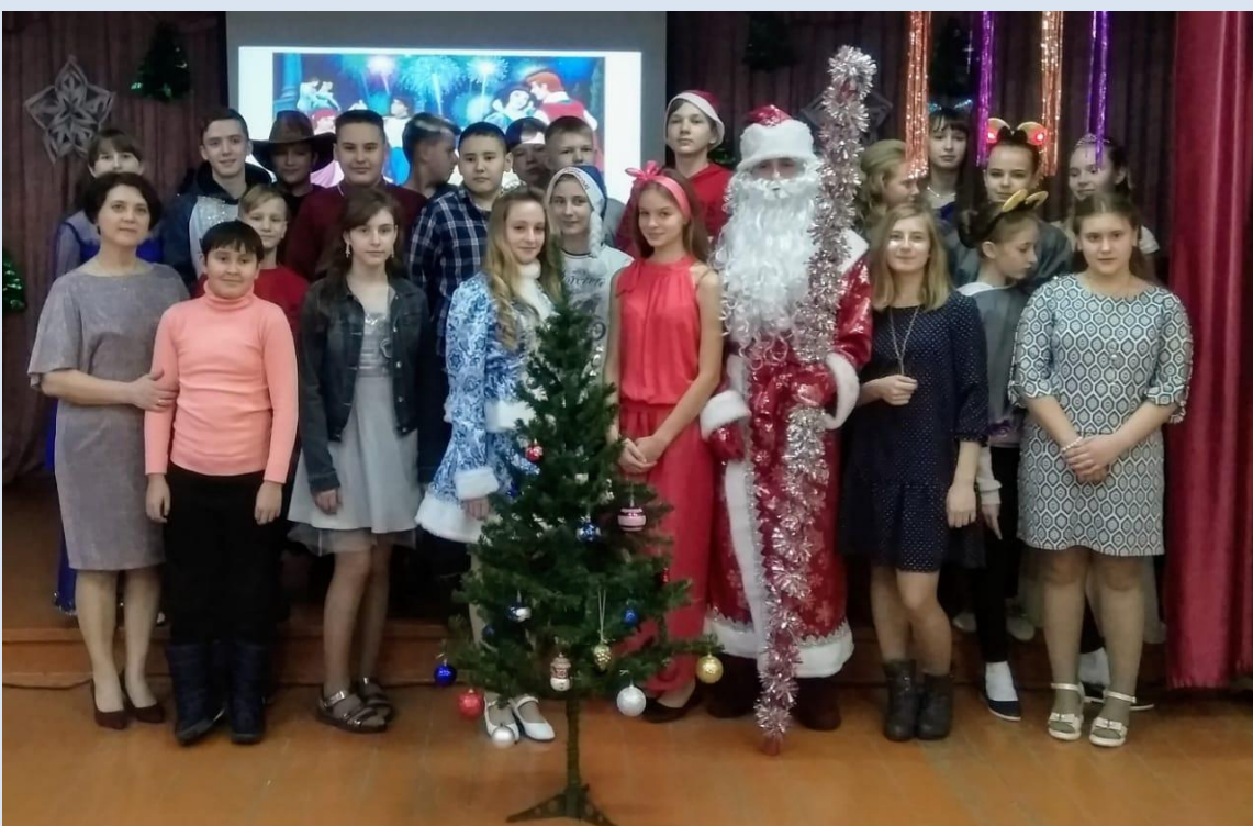
Новый год в 7 классе.

ственной самодеятельности. Тем самым ребята общими силами устроили себе настоящий праздник. В этот вечер в зале лицея собралось множество выпускников. По тому, как они общались со своими учителями