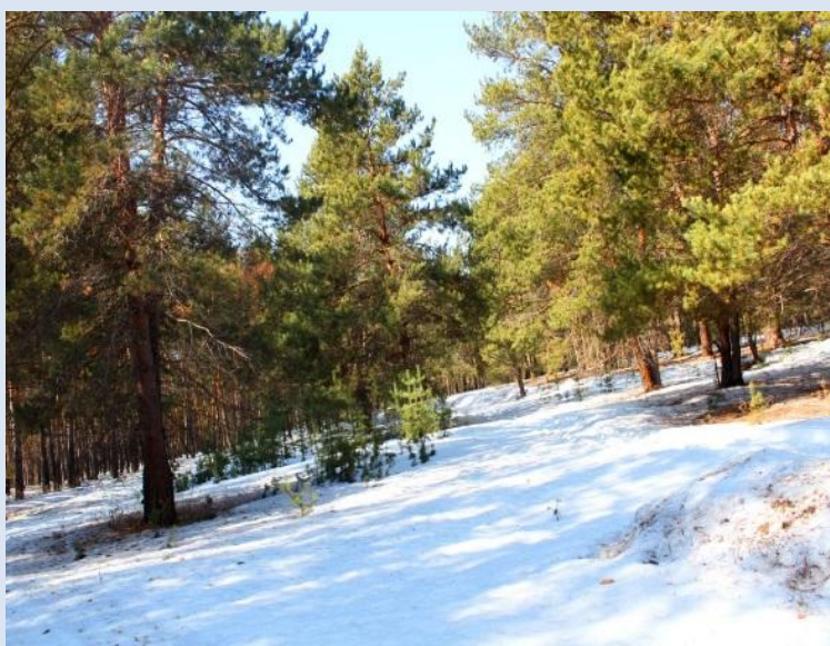
На зимней опушке.