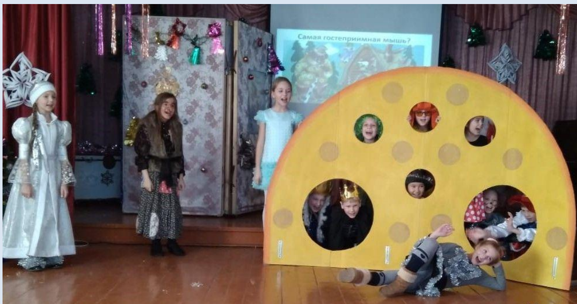
«Мышиный бунт», в 3 классе.

В этот же день вечером прошло новогоднее мероприятие для ребят из старших классов. К нему каждый из классов подошел творчески, поскольку организаторы праздника, 9 А класс, накануне раздал задания: приготовить по номеру художе-