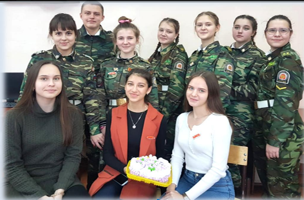
День рождения ЛИГИ