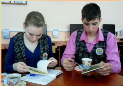
За чтением сборников стихов