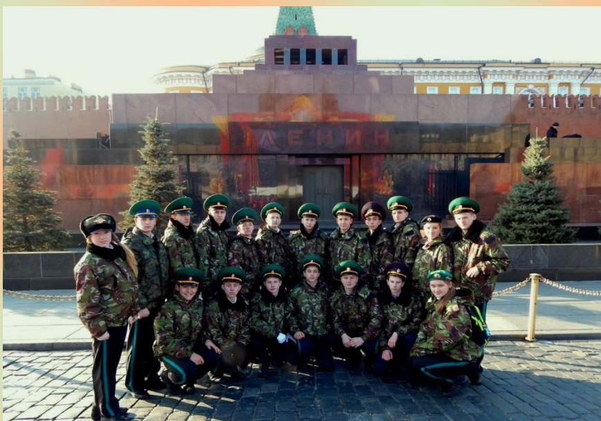
Команда кадет лицея в г. Москве на Красной площади

Подготовила Мария Кунц.