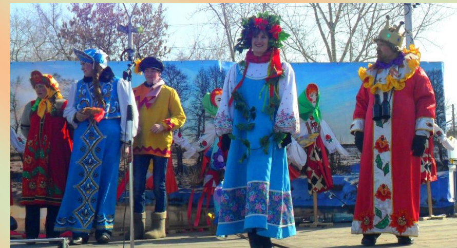
Момент театрализованного представления

Не зря в народе Масленицу называют широкой. Широкая Масленица потому и "широкая", что развлечений и угощений нашлось каждому: кому - блины, символизирующие солнце, кому - русские народные игры и забавы. Самые ловкие и смелые покоряли вершину столба. Отраднo, что достойным соперником