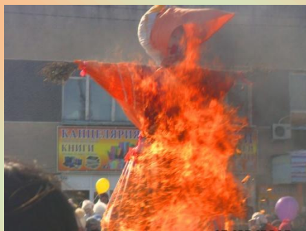
Сжигание чучела Масленицы

В этом году последний день масленичной недели пришелся на 13 марта. Михайловцы как всегда отметили его шумно и весело. На центральной площади села прошли традиционные гуляния. Судя по погоде и улыбкам людей в этот день, получился действительно праздник весны и солнца. Надо сказать, что в этом году нам было очень приятно наблюдать за тем, как в празднике принимали участие люди, которые имеют непосредственные отношения к лицею.