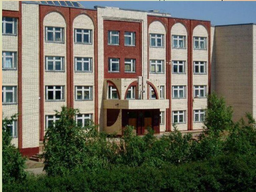
Школа №19 г. Яровое

следующих номерах мы проводили опросы о питании в школьной столовой, о наших ребятах, пишущих левой рукой. Оказалось, что в нашей школе тридцать левшей, а ребят, которые пишут правой рукой – четыреста семьдесят пять. Проконсультировавшись со специалистами, мы посоветовали родителям левшей не переучивать их, потому что, по мнению психологов и врачей, биологическую природу ребенка не переделаешь. Со всем скоро выйдет новый выпуск, и в нем мы расскажем о нашей поездке в Санкт-Петербург.