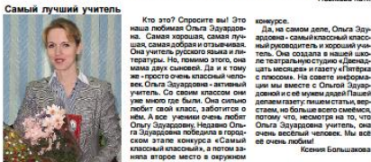
Первая полоса «Пятерки с плюсом»